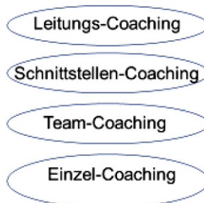
Abb. 2 Setting Erweiterung im Transformations-Coaching