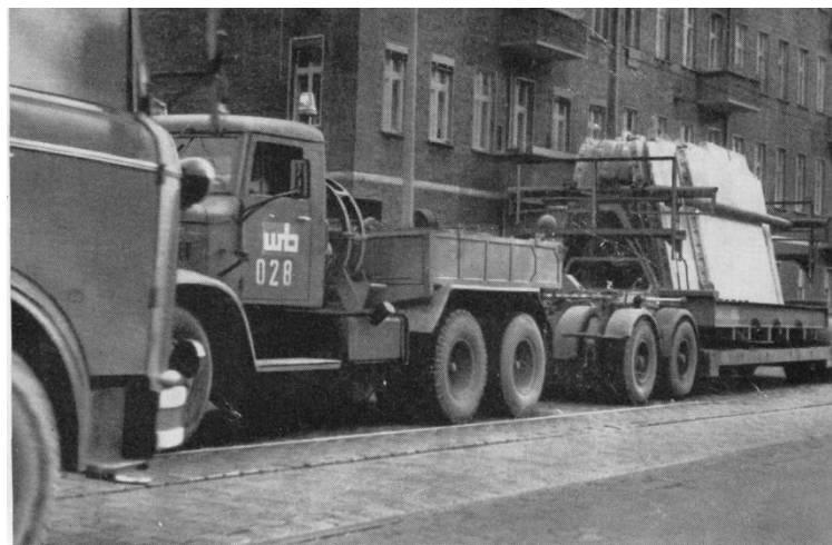
Abbildung 3: Transport von vorgefertigten Bauteilen 71

Im Jahre 1960 traf die allgemeine Wirtschaftskrise der DDR mit der Transportkrise zusammen. 69 Der schlechte Transportservice der VEB-LKW-Unternehmen löste eine Krise im Bausektor aus. Baustellen in Berlin und Leipzig konnten nicht weiter arbeiten, da die Anlieferung von Material misslang. Das LKW-Unternehmen „VEB Güterverkehr Berlin“ führte alle Transporte für die Bauwirtschaft in Berlin aus und hatte folgende Orte anzusteuern: die Werke für vorgefertigte Betonelemente, für Ziegel und für Zement, die VEB Tiefbaugesellschaft und die Baustellen selber. Nach einer Analyse des VEB Güterverkehr Berlin konnte die Gesellschaft nicht die Koordination der Transporte von vorgefertigten Betonelementen mit den Geräten für Verladung und Entladung bewerkstelligen. Lange, unproduktive Wartezeiten entstanden. Das gleiche Koordinationsproblem trat auf beim Transport der Bagger mit Flachbett-LKW. In der ersten Hälfte des Februars 1960 entstanden mehr als 1700 Stunden von Wartezeit. Für die verzögerte Erfüllung der Lieferverpflichtungen musste der VEB Güterverkehr hohe Vertragsstrafen zahlen. 70