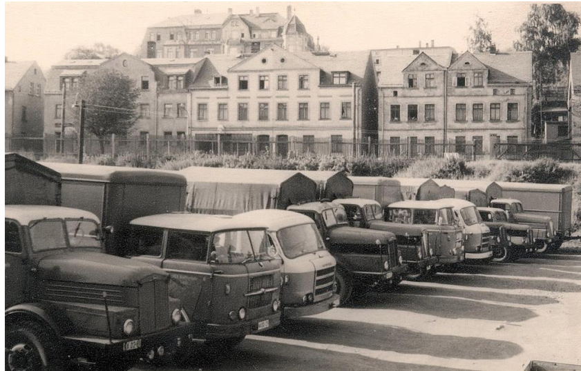
Abbildung 1: Hohe Typenvielfalt im VEB Kraftverkehr Greiz 50

Im LKW-Sektor wurde die Knappheit besonders verstärkt durch die dezentrale Führung der VEB-LKW-Unternehmen. Anstatt dem strategischen Ansatz zu folgen, in der gesamten DDR LKW lediglich aus einer eng begrenzten Auswahl von LKW-Modellen beschaffen, um die Pflege und Reparatur zu vereinfachen, was ein nahe liegender Ansatz in einer Zentralverwaltungswirtschaft gewesen wäre, besaßen die VEB-LKW-Unternehmen Hunderte von verschiedenen Modellen, die aus den Unternehmen ihrer Region herausgezogen worden waren. Damit standen sie vor einem unlösbaren Problem der Ersatzteilbeschaffung. Viele Ersatzteile mussten lokal in den Reparaturwerkstätten mit großem Aufwand mühsam nachproduziert werden, so dass keine Produktivitätseffekte einer großen Organisation eintreten konnten.