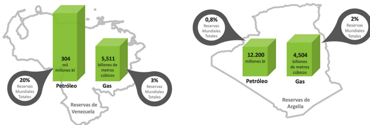
FIGURA 1: RESERVAS DE ARGELIA Y VENEZUELA 1

A su vez, Venezuela posee las mayores reservas de petróleo del mundo, unos 304.000 millones de barriles. También posee reservas de gas natural sin explotar, estimadas en 5,511 billones de metros cúbicos, lo que la convierte en la séptima reserva mundial. Alrededor del 98 por ciento de las exportaciones venezolanas son cargamentos de petróleo, mientras que el consumo nacional de energía procede principalmente de la producción hidroeléctrica, lo que deja sus enormes reservas disponibles para la exportación.