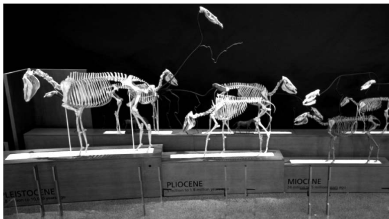
Abb. 1: American Museum of Natural History 2021: Evolution of Horses. Part of Hall of Advanced Mammals https://www.amnh.org/exhibitions/permanent/advanced-mammals/evolution-of-horses

die geläufigen Lehrmeinungen spiegeln. Beispielhaft sei hier auf die Ausstellung zur Geschichte der Pferdefossilien im Naturhistorischen Museum in New York verwiesen, mit der sich Latour (2014) befasst. Er zeigt hier plastisch – für den vorliegenden Fall exemplarisch und an einem aktuellen Beispiel nachvollziehbar – die zuvor beschriebene Verwobenheit von Erkenntnisprozess und Ausstellung auf.