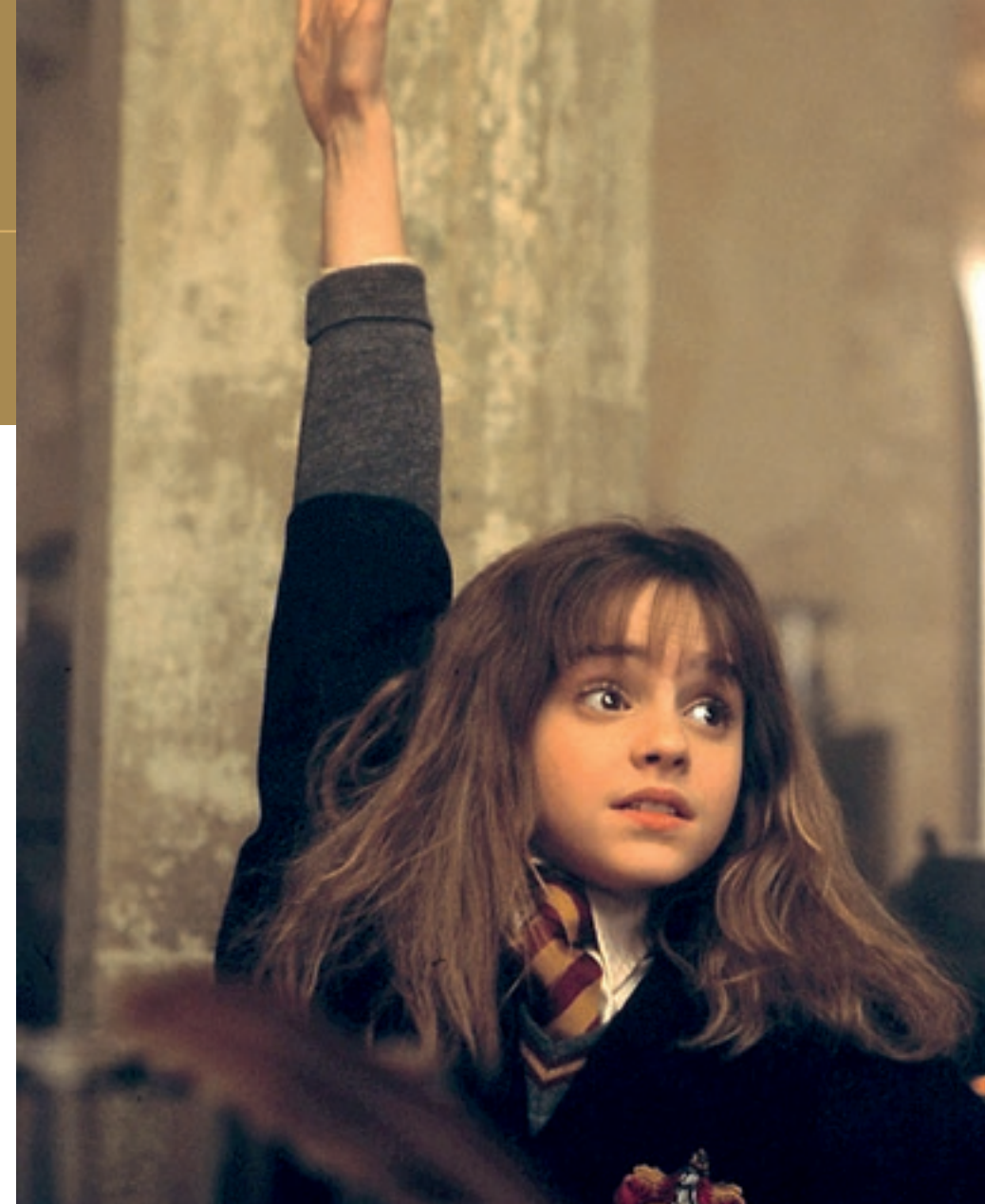
Erst Klassenstreberin, dann Vorkämpferin: Hermine Granger in „Harry Potter und der Stein der Weisen“.