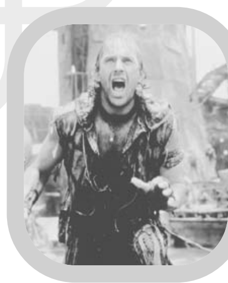
Waterworld (USA 1995).

Die folgenden Beispiele stammen aus dem Projekt Bestandsaufnahme Kinderfernsehen und sind Teil einer Stichprobe von drei Programmtagen von 15 Sendern und ca. 500 Sendestunden. 1