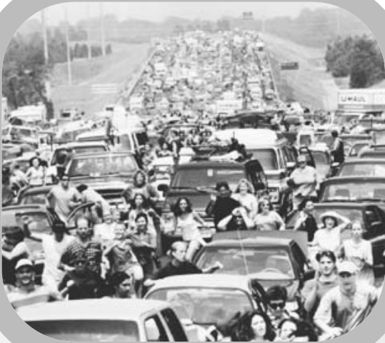
Deep Impact (USA 1998).

nen laufen) sind verschiedene Familienepisoden eingeflochten. In einem Nebenstrang der Geschichte geht es um eine Reporterin, die über die Abwehraktionen der NASA berichtet. Sie wird angesichts ihres Vaters, der ihre Mutter wegen einer jüngeren Frau verlassen hat, wieder zum Kind. Trotzig wie ein Kind überwirft sie sich mit ihrem Vater, weil dieser ihrer Bitte, wieder zur Mutter zurückzukehren, nicht nachkommt. Erst im Anblick des „jüngsten Gerichts“ am Ende des Films, einer gigantischen Flutwelle, die beide überrollt und tötet, finden Vater und Tochter, in der Gewissheit ihres Todes, wieder zueinander.