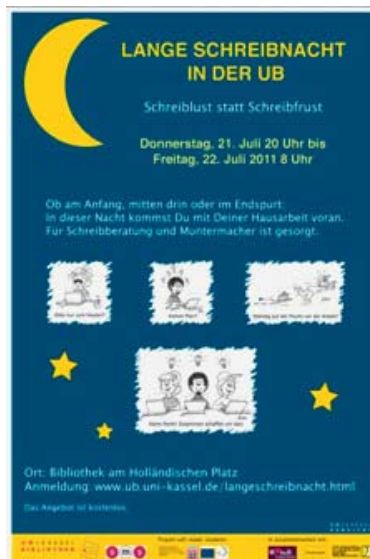
Abbildung 1: Plakat für die Lange Schreibnacht

Im März dieses Jahres waren es allerdings die universitären Schreibzentren und nicht die Bibliotheken, die eine bundesweite Lange Nacht der aufgeschobenen Hausarbeiten veranstalteten. Nach Berichten des Göttinger Schreibzentrums wurde sie von den Studierenden mehr als dankbar angenommen. Daraufhin entschlossen wir uns, eine solche Aktion auch unseren Kasseler Studierenden anzubieten. Gemeinsam mit dem Projekt „self-made-students“ des hiesigen Servicecenters Lehre veranstalteten wir die erste Lange Schreibnacht in der UB. Wir wählten als Termin den 21. Juli zu Beginn der vorlesungsfreien Zeit, in der viele Studierende mit dem Schreiben von Hausarbeiten beschäftigt sind. Unser Ziel war