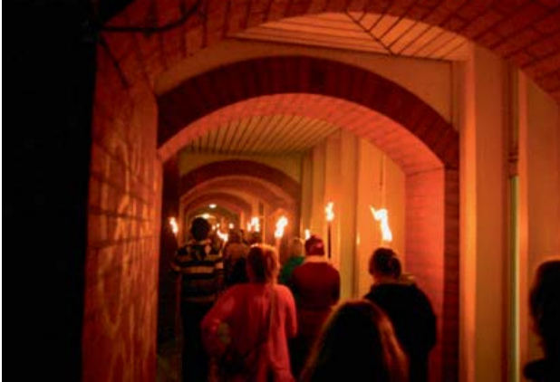
Abbildung 5: Mitternächtlicher Fackelzug über den Campus

Wem nach Mitternacht die Augen schwer wurden, konnte sich entweder mit Brain-Gym-Übungen aufmuntern oder auch eine Entspannungsphase bei Klangschalen-Yoga einlegen. Das durchgängige kostenlose Angebot an Kaffee und Kaltgetränken wurde die ganze Nacht hindurch mit Begeisterung angenommen.