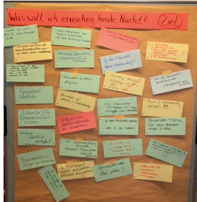
Abbildung 7: Studentische Ziele für die Lange Nacht