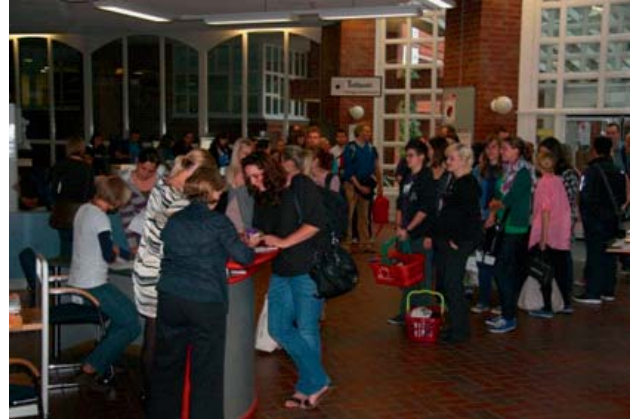
Abbildung 3: Anmeldeschlange