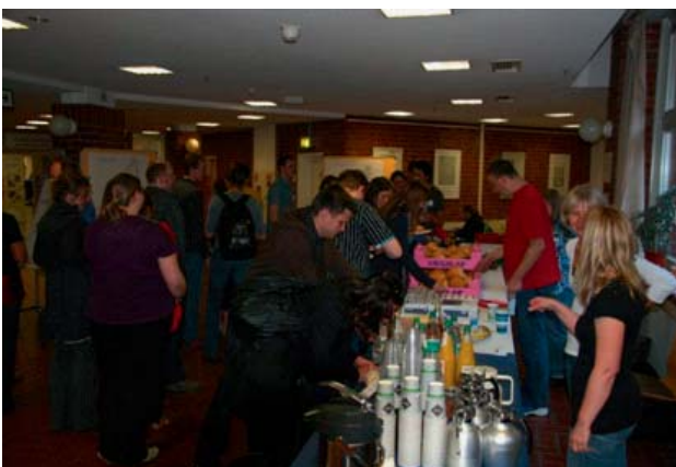
Abbildung 6: Andrang am Frühstücksbuffet um 7 Uhr morgens

Die Ziele für den Abend waren meist hoch gesteckt: „Einen Anfang finden“, „fertig werden!“ oder auch „VWL-Erkennt-