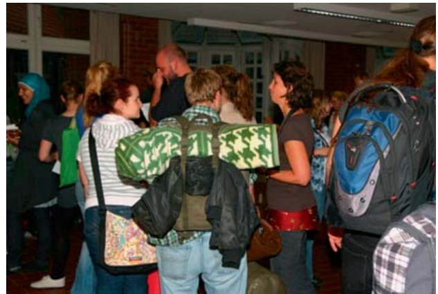
Abbildung 4: Mit Rucksack und Isomatte in die Bibliothek

Insgesamt nahmen 355 Studierende teil, wovon sich 252 im Vorhinein angemeldet hatten. Schon vor Beginn der Registrierung ab 19.30 Uhr war die gesamte Eingangshalle mit Teilnehmern überfüllt, die – mit Schlafsack und Isomatte ausgerüstet – ungeduldig auf Ihre Namensschilder warteten.