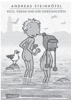
Rico, Oskar und der Diebstahlstein (2011)

[A]m Schluss schaffte er es dann endlich zu seiner treuen Frau zurück und machte all diese Typen platt, mit Pfeil und Bogen und so weiter. Extrem cool! (T 59f.)