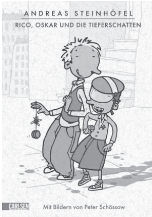
Rico, Oskar und die Tieferschatten (2008)

die Schröders, Beschützer der Diebe oder Es ist ein Elch entsprungen genannt. Dass Steinhöfels Romane dennoch nicht als Problembücher rezipiert und rubriziert werden, liegt vornehmlich an ihrer besonderen literarischen Faktur. Im Folgenden soll daher anhand der Rico, Oskar ... -Trilogie demonstriert werden, mit welchen literarischen Techniken es Steinhöfel gelingt, die problematische Familiensituation zu relativieren, ohne dabei zu idealisieren, zu sentimentalisieren oder zu moralisieren. Dazu wird – nach einer soziologischen Bestandaufnahme – der Fokus auf die Erzähltechnik bzw. -perspektive gelenkt, um zu zeigen, dass es sich bei Rico um einen unzuverlässigen Erzähler handelt. Außerdem kann anhand der intertextuellen Anspielungen auf Homers Odyssee die Sehnsucht nach einer klassischen