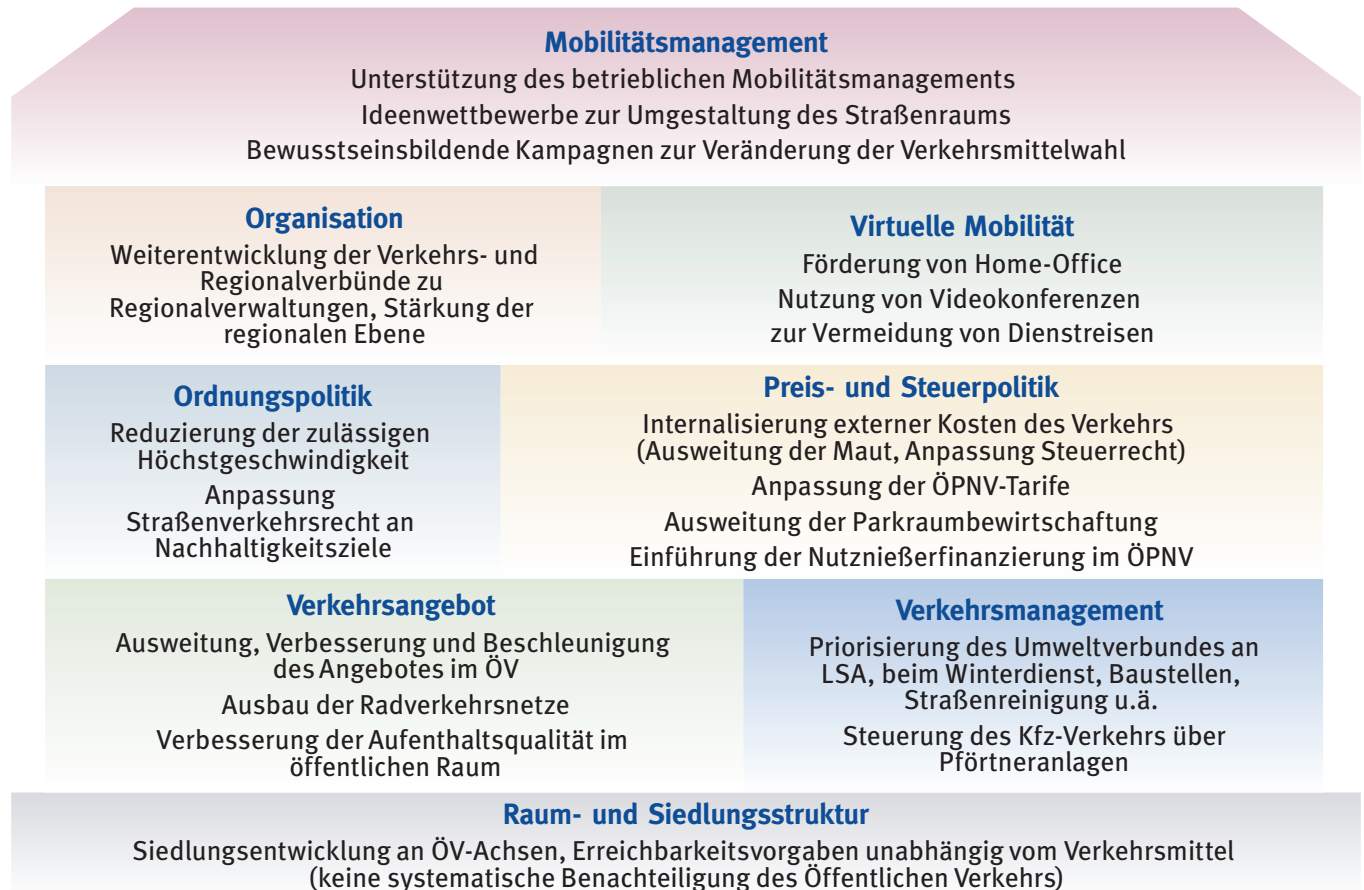
Abb. 2: Handlungsfelder eines integrierten Handlungskonzepts

Anknüpfend an eine integrierte Push- und Pull-Strategie ist es wichtig, dass Maßnahmen aller unterschiedlichen Handlungsfelder berücksichtigt und kombiniert umgesetzt werden. Dabei verstärkt die Kombination von Maßnahmen gleicher Wirkrichtung ihre Wirksamkeit. Das in Abb. 2 dargestellte Handlungskonzept zeigt die wichtigsten Handlungsfelder mit exemplarischen Maßnahmentypen, die zu einer Reduzierung des Kfz-Verkehr beitragen können. Die genannten Maßnahmentypen beziehen sich dabei auf unterschiedliche Planungsebenen und nicht nur auf die Stadt Kassel.